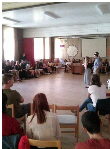
Mladí ľudia zdieľajú inšpirujúce nápady a skúsenosti.